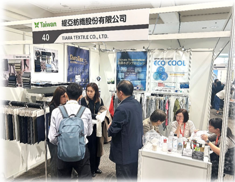
緹亞買主洽談現場