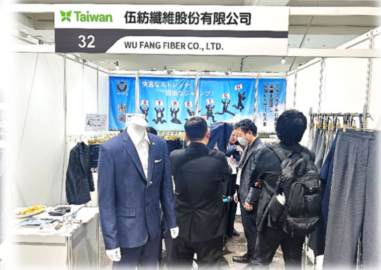
伍紡買主洽談現場