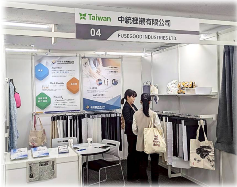
中統買主洽談現場