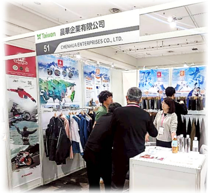
晨華買主洽談現場