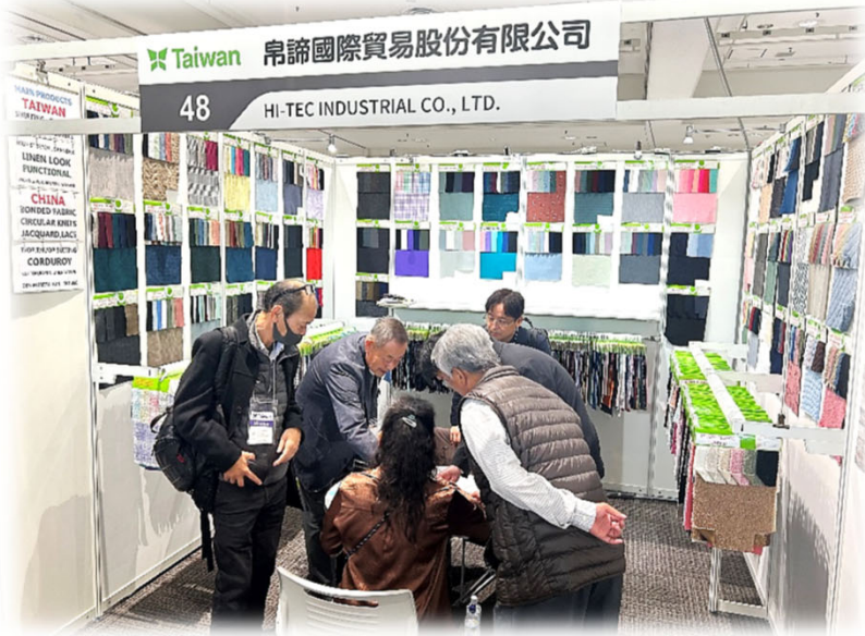
帛諦買主洽談現場