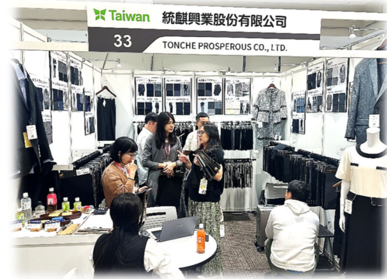
統麒買主洽談現場