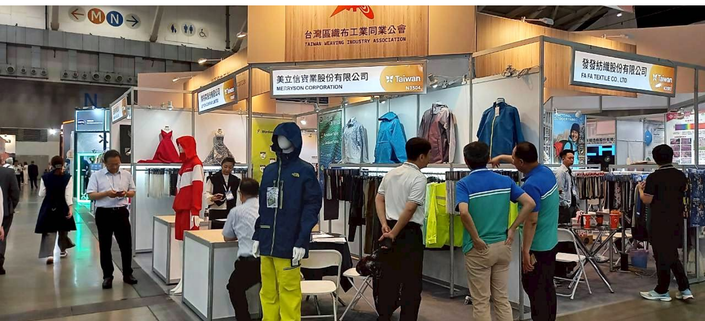
美立信與傑特森買主洽談現場