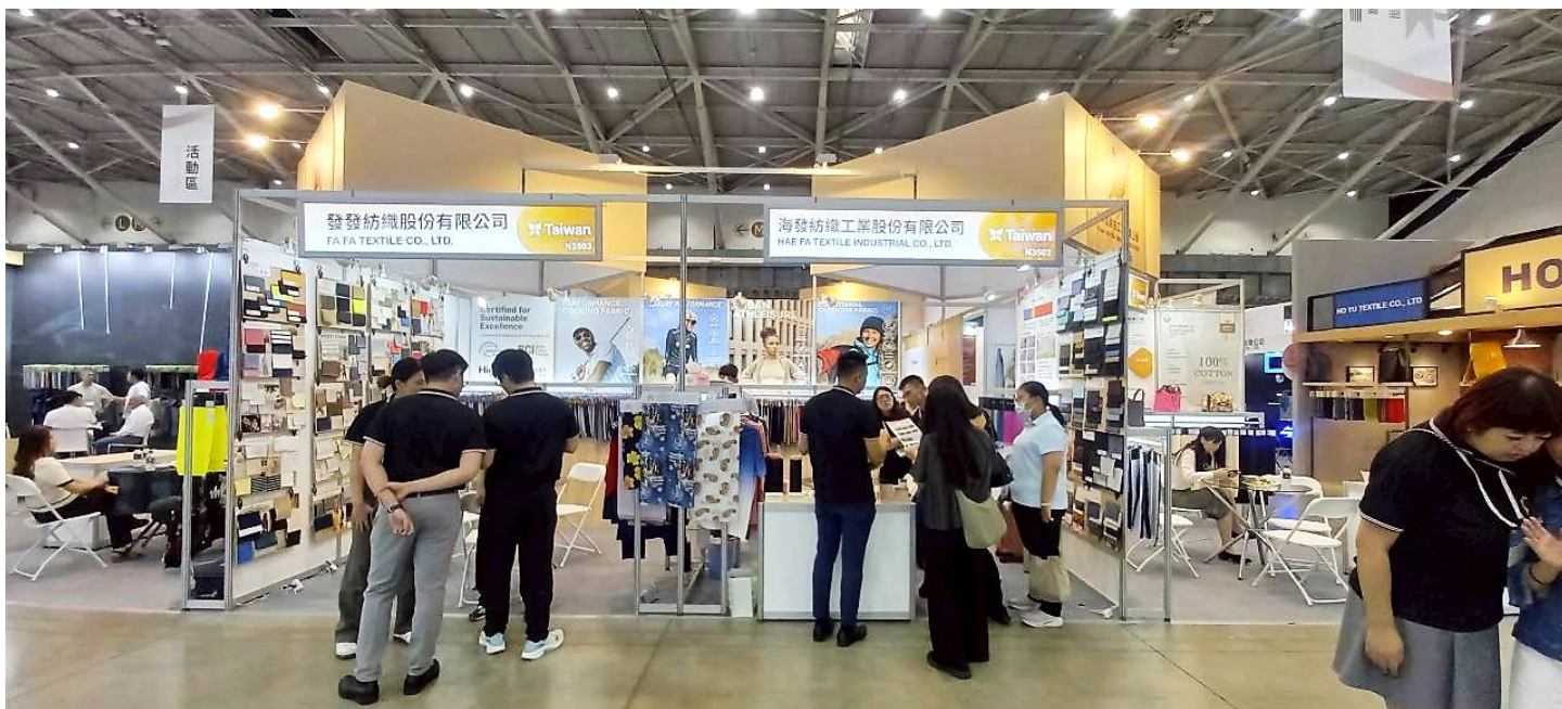
發發與海發買主洽談現場