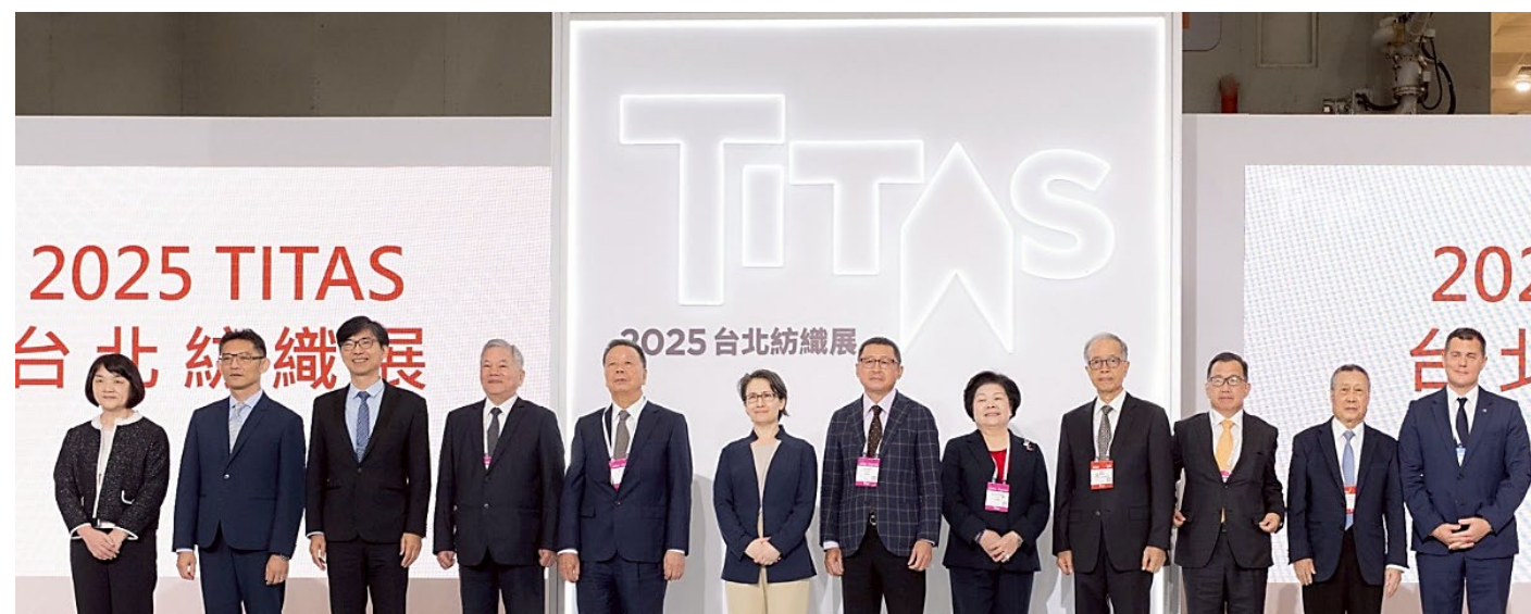
2025年台北紡織展(TITAS 2025)在南港展覽館舉辦。蕭美琴副總統、紡拓會董事長郭紹儀及多位貴賓共同出席，祝賀2025台北紡織展（TITAS）展出順利成功。

副總統蕭美琴致詞指出，政府推動「百工百業AI應用計畫」，協助業者導入智慧製造、提升開發效率與客製能力。她肯定紡織業者多年來「根留臺灣」的堅持，投入高值化與永續製造，並表示政府將持續推動出口與供應鏈支持方案，協助產業強化全球競爭力。