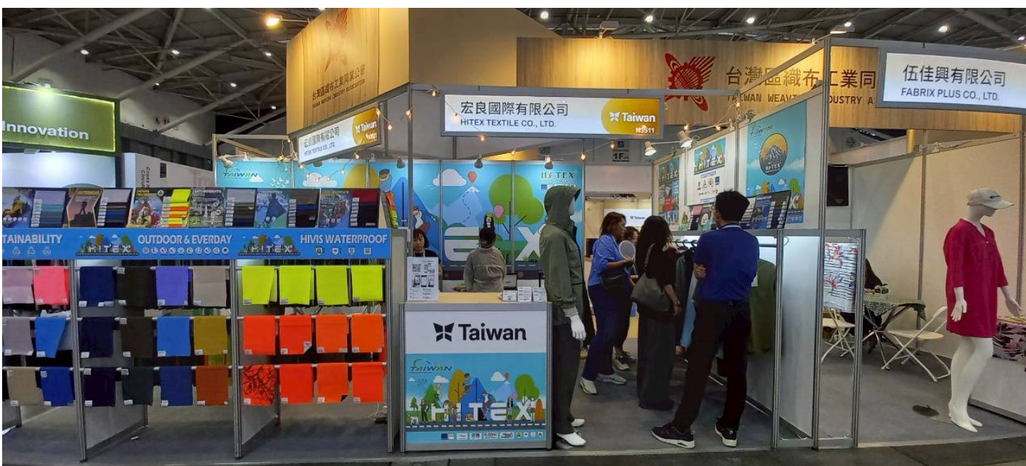
宏良買主洽談現場