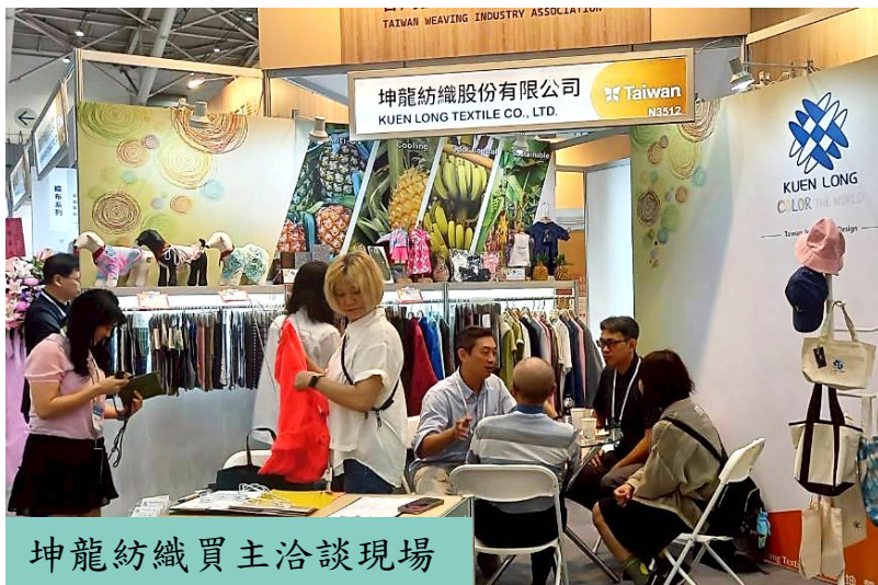
坤龍紡織買主洽談現場