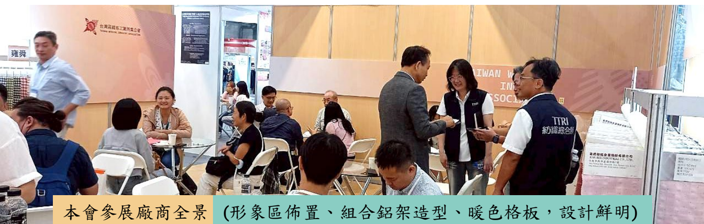
本會參展廠商全景 (形象區佈置、組合鋁架造型、暖色格板，設計鮮明)