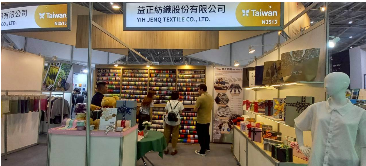
益正買主洽談現場