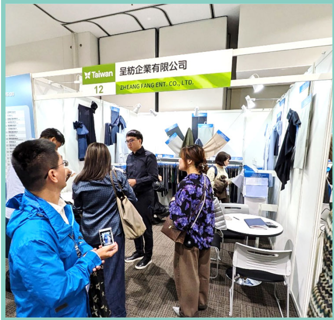
呈紡買主洽談現場