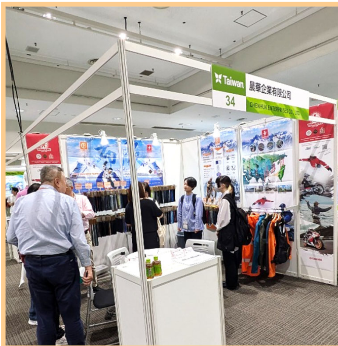
晨華買主洽談現場