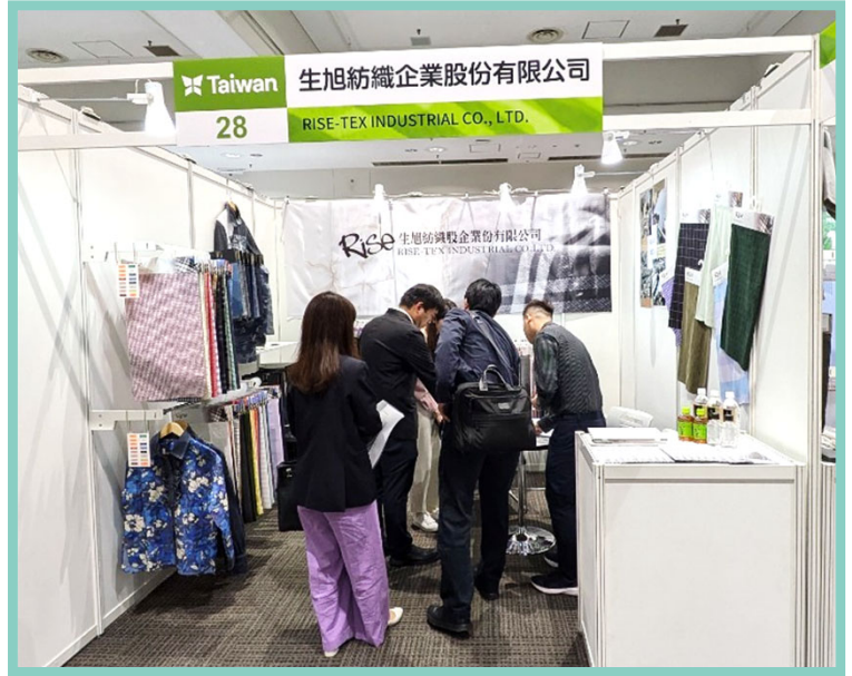
生旭買主洽談現場