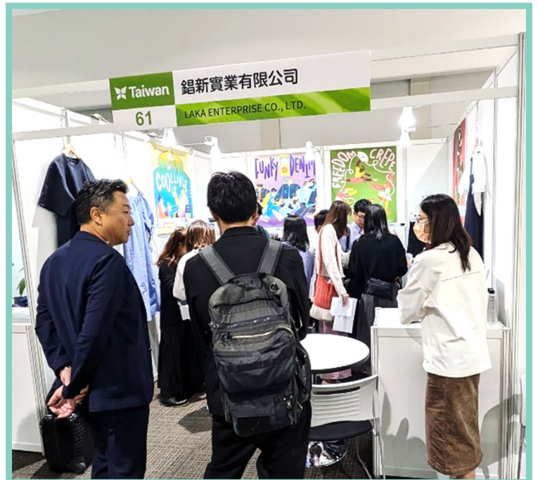
鋁新買主洽談現場