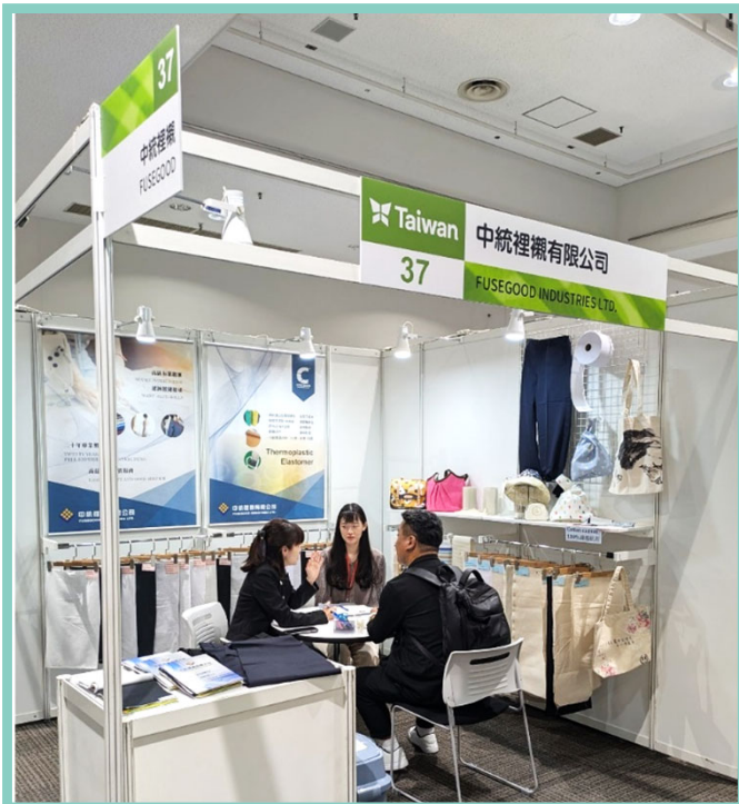
中統買主洽談現場