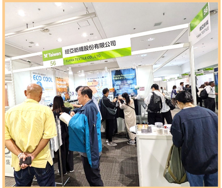
緹亞買主洽談現場