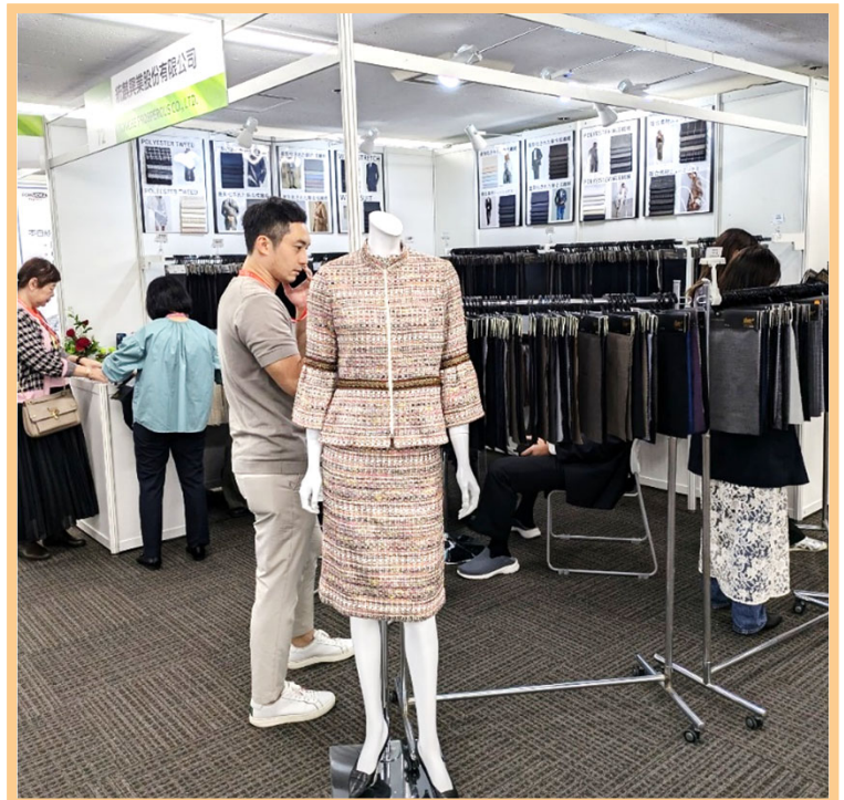
統麒買主洽談現場