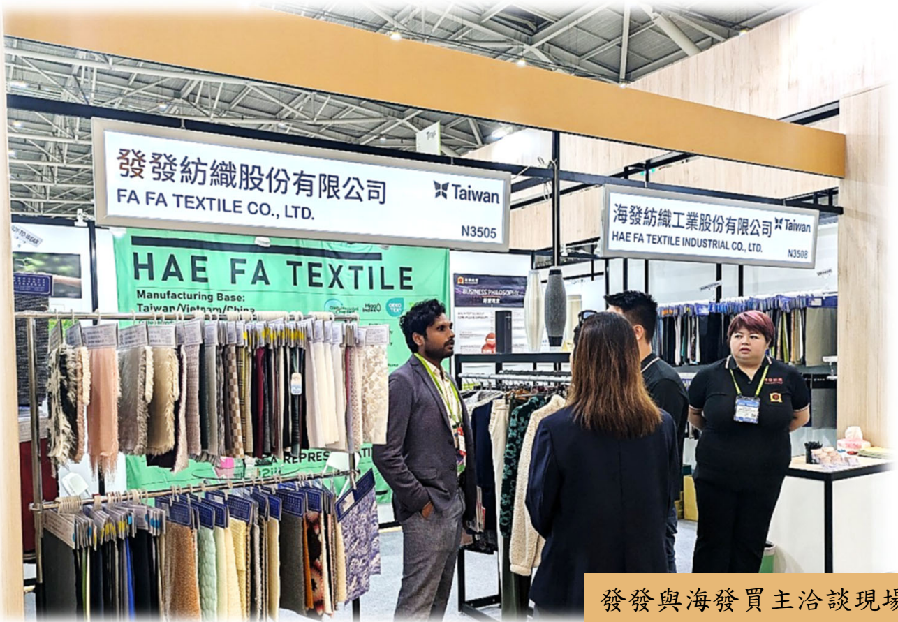
發發與海發買主洽談現場