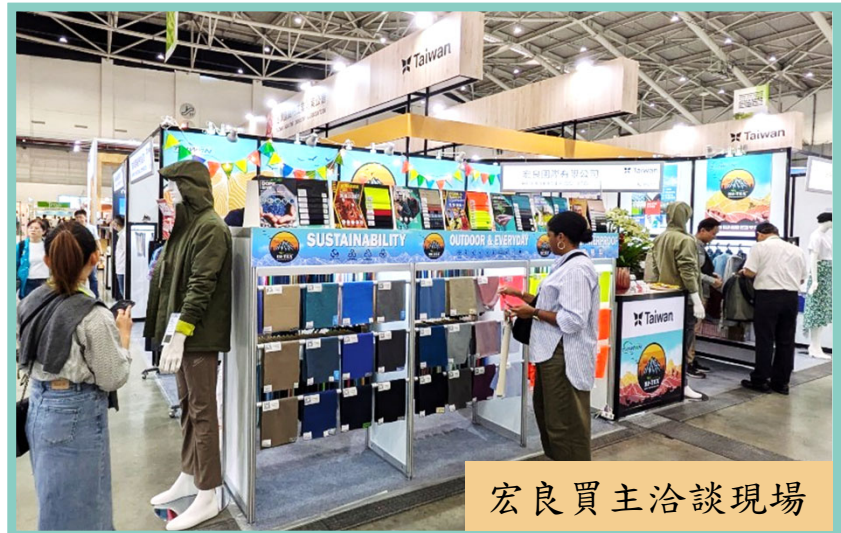
宏良買主洽談現場