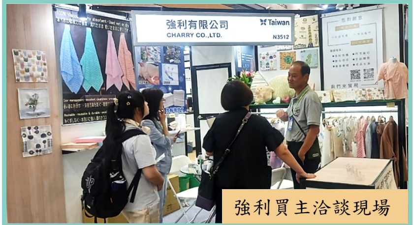
強利買主洽談現場