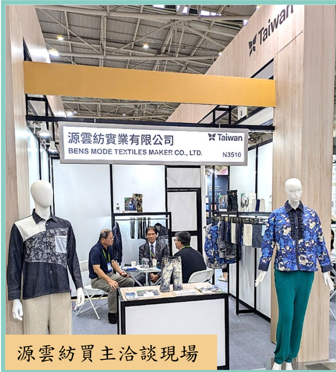
源雲紡買主洽談現場