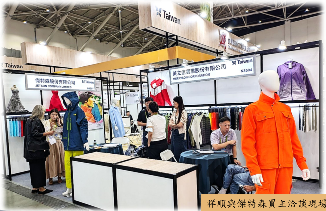
祥順與傑特森買主洽談現場