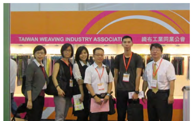
經濟部國際貿易局長官林建興研究員(右三)蒞臨本會攤位訪察