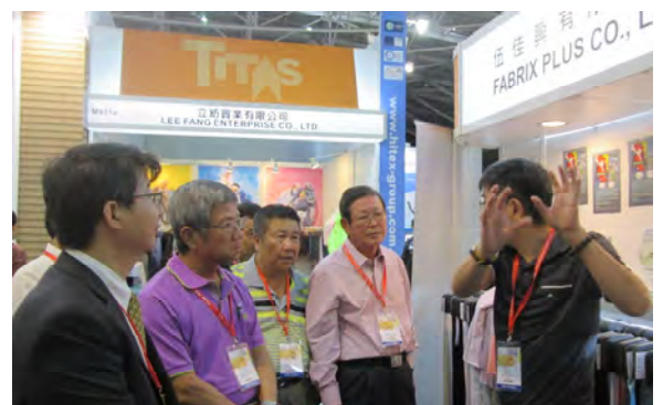
葉前理事長至會員廠伍佳興攤位參訪