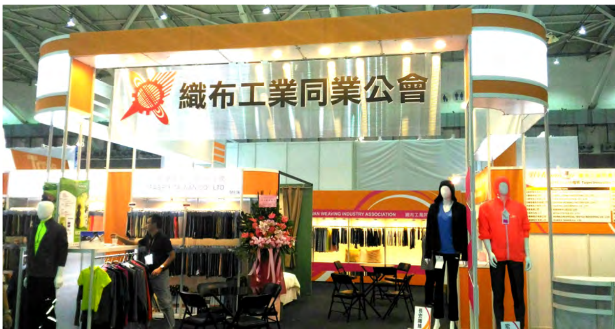
織布公會攤位全景

2017年台北紡織展已訂於10月16日至18日假台北世貿中心南港展覽館舉行，在經濟部國際貿易局及業界的鼎力支持下，台北紡織展必將持續推升台灣紡織業的競爭力，並協助業者積極開發國際市場！