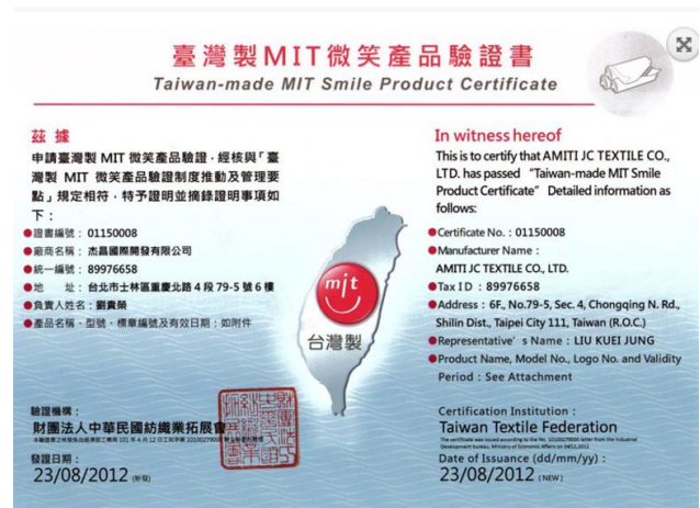
【杰昌榮獲MIT微笑產品標章】