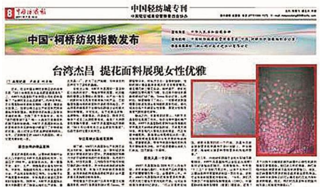
【中國紡織報刊杰昌特報】