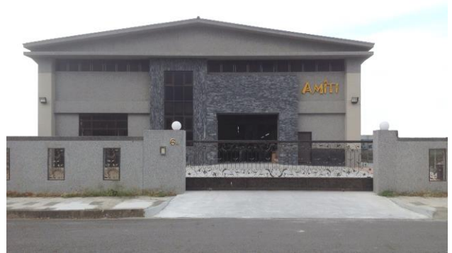
【杰昌宜蘭利澤工業區新廠】