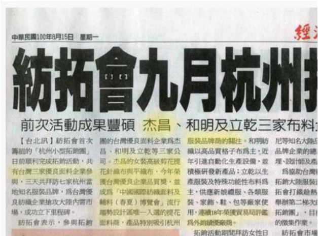
【杰昌參與紡拓會杭州小型拓銷團】