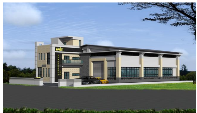
【杰昌宜蘭利澤工業區新廠】